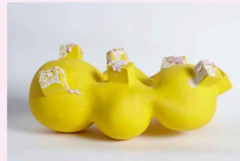
Nadine Rouphael, Yellow , 2022, céramique, base en finition velours avec glaçage à effet spécial, 43 x 30 x 20 cm.