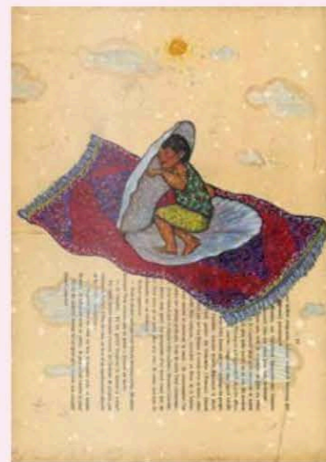
Bilal Bahir, Coquille de Bachelard , 2020, technique mixte sur papier ancien, 42 X 31 cm. © de l'artiste / Gery Art Gallery, Namur

collectionnés par nombre de musées, d'institutions de renommée internationale et de connaisseurs occidentaux. Outre une sélection d'exposants spécialisés dans les arts plastiques, le salon présente une section de design incluant meubles, installations et objets de qualité qui incarnent magie et raffinement, éclectisme et audace. Carrefours culturels multimillénaires, les pays du M.E.N.A sont, en effet, réputés pour leur savoir-faire traditionnel se mariant aux formes contemporaines riches d'influences multiples. Ici émergent des créations surprenantes, émouvantes et originales. Ce design contemporain révèle son enracinement profond dans l'expérience et le temps, fruit des échanges, du brassage et de la succession des peuples et des civilisations.