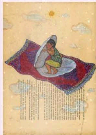
Bilal Bahir, Coquille de Bachelard, 2020, gemengde techniek op oud papier, 42 x 31 cm. © De kunstenaar. Gery Art Gallery, Namen.

Van veel van die kunstenaars wordt al werk verzameld door tal van musea, internationaal befaamde instellingen en westerse kenners. Behalve een selectie exposanten gespecialiseerd in beeldende kunsten presenteert de beurs ook design, met name meubelen, installaties en objecten die getuigen van eclecticisme, raffinement en lef. Al duizenden jaren vormen de ME.NA-landen een boeiende culturele smeltkroes. Ze zijn befaamd om hun traditionele vakkennis, waarbij de vele culturele invloeden nu ook worden gepaard aan hedendaagse vormen. Het resultaat zijn verrassende en hoogst originele werken. Hoe visionair dit hedendaagse design soms ook is, toch is het diep geworteld in de tijd en de ervaring. Het is de vrucht van een kruisbestuiving tussen vele volkeren en beschavingen die elkaar hebben opgevolgd in de loop der eeuwen.