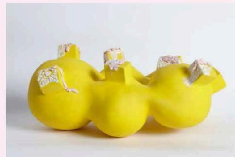
Nadine Roupheal, Yellow, 2022, keramiek Céramique, basis in fluwelen afwerking met speciaal glazuureffect, 43 x 30 x 20 cm. © De kunstenaar. Atelier Nadeen, Beiroet.