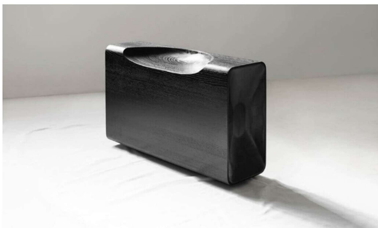
Mohammad Ghaderi♂, Tarang, 2021, chaise, bois, 80 x 30 x 50 cm