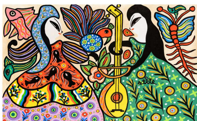
Baya♀, Sans Titre, 1990, gouache sur papier, 78 x 55 cm