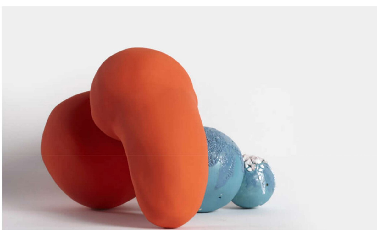
Nadine Roufael♀, Orange, 2022, Céramique, base en finition velours avec glaçage à effet spécial, 40 x 26 x 20 cm

Après dix ans de succès dans l'organisation de la Beirut Art Fair, Laure d'Hauteville , sa fondatrice, a lancé la foire Menart Fair (comprenez Middle East – North Africa Art Fair ) en 2021, qui a rapidement pris place dans le paysage événementiel parisien. L'objectif de cette nouvelle foire est de mettre en lumière la jeune génération d' artistes et de designers d'une région culturellement riche et diversifiée. Essentiellement orientée vers les arts plastiques dans sa version française, l'événement bruxellois sera plus axé sur le design sous toutes ses facettes. Que ce soit par le truchement du verre, du bois, du tissu ou de la pierre, un panel de jeunes artistes issus de différentes cultures et pays sera présenté dans le sublime cadre de la villa Empain .